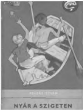
A régi kiadású könyv borítója

1. Sorold fel a főszereplőket! Írd melléjük, hogy kinek, mit kellett vinnie a táborozáshoz!