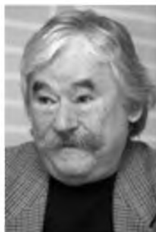
Csukás István József Attila és Kossuth-díjas magyar költő, író. Született: 1936. április 2. (életkor 77), Kisújszállás

Vakáció a halott utcában (Ez Rákospalotán játszódik.) http://www.youtube.com/watch?v=qHtkLRvbiYI