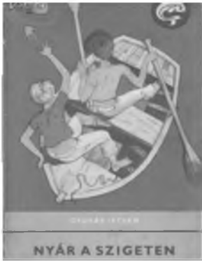
A régi kiadású könyv borítója

1. Ki ébredt fel elsőnek a második nap reggelén? Mi történt vele?