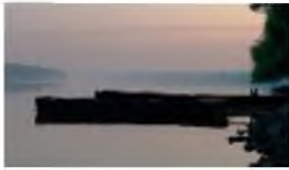
Hajnali Duna part

1. Milyen volt a hajnali Duna part? Írj ki néhány szót, szókapcsolatot!