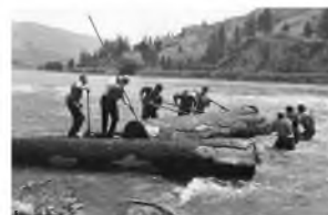
FARÖNKÖK A DUNÁBAN