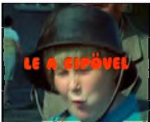
BÁDOGOS, BOGRÁCCSAL A FEJÉN